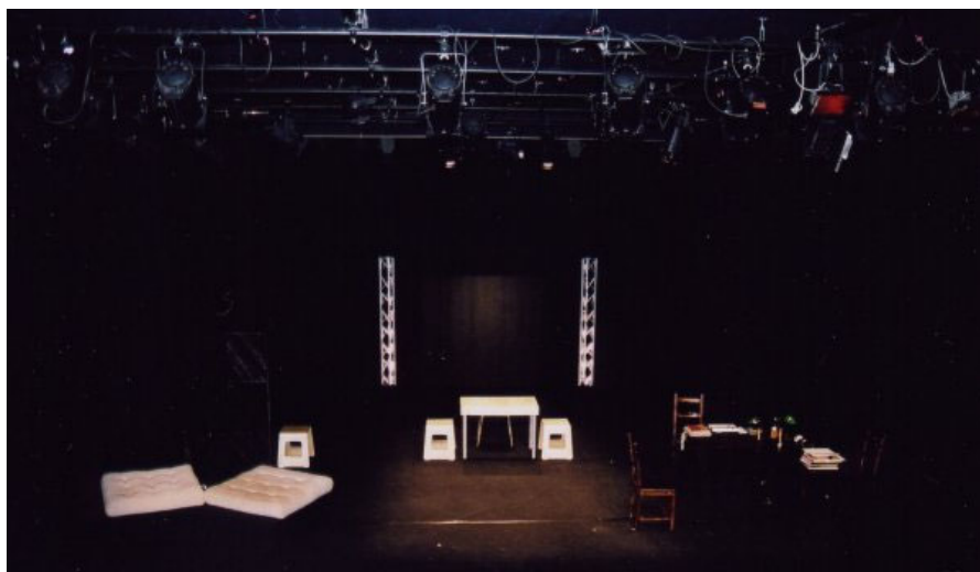
L'émission de télévision Décor (Orsay Mars 2003)