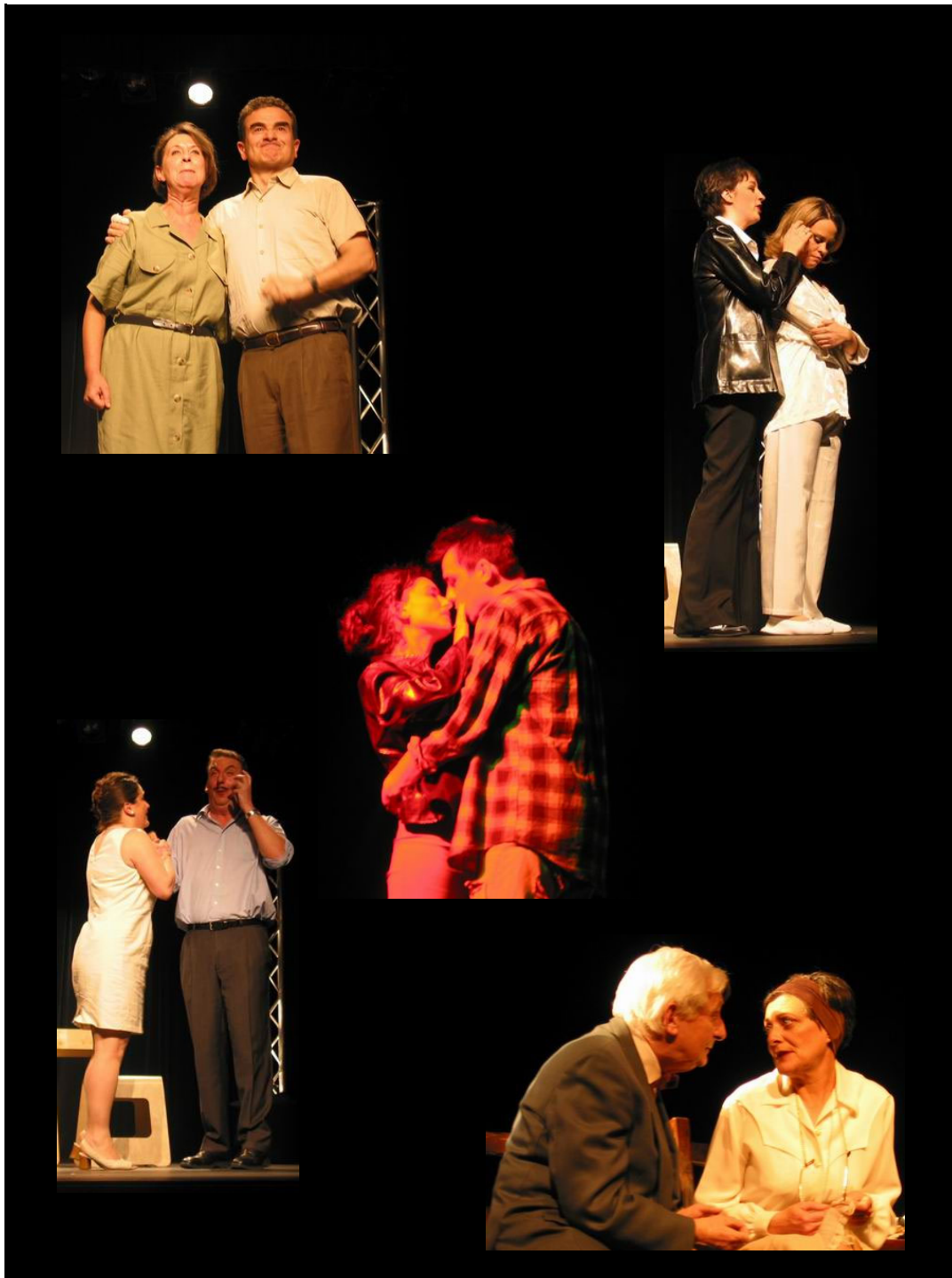
Ce spectacle a été créé en mars 2003 à Orsay.