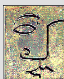
Masque d'Or - 2001